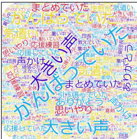
“ぼかぼかあど” 累積グラフ